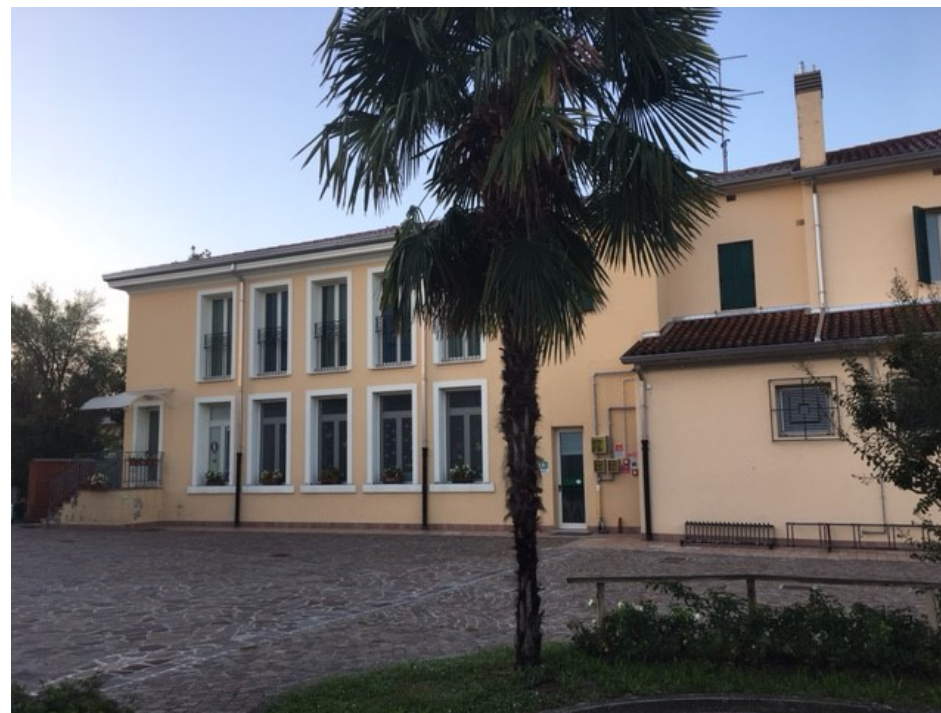
Il Patronato: Casa della Comunità Parrocchiale